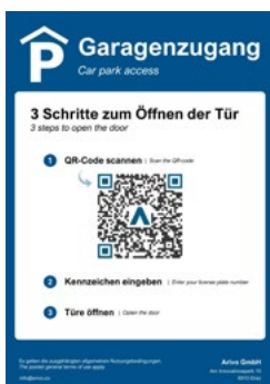
1. QR-Code scannen