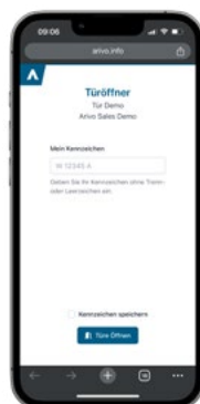
2. Kennzeichen eingeben